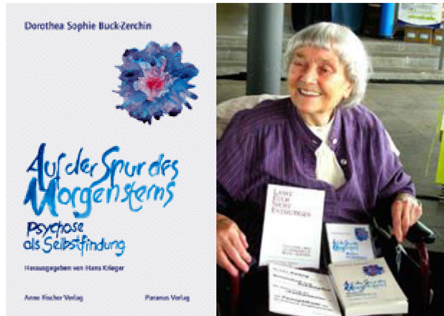
Dorothea Buck Auf der Spur des Morgensterns Paranus Verlag